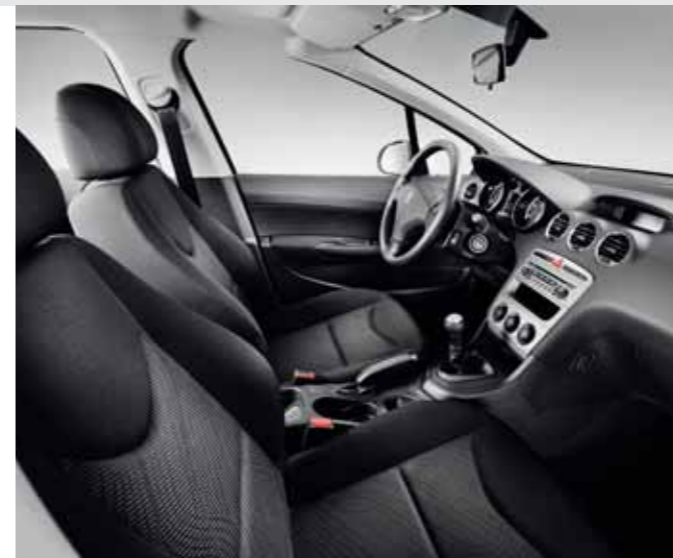
Access – Mistral Sibayak