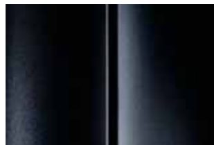
Черный (Noir Perla Nera)