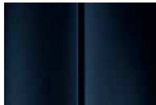
Темно-синий (Bleu Bourrasque)