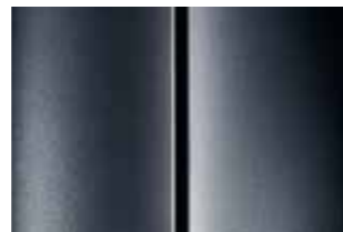
Серый (Gris Shark)