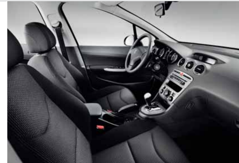
Active – Strada