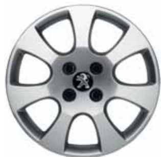
стальные диски с декоративными колпаками Toliman 16" (Access, Active)