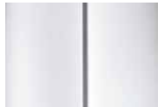
Белый (Blanc Banquise)