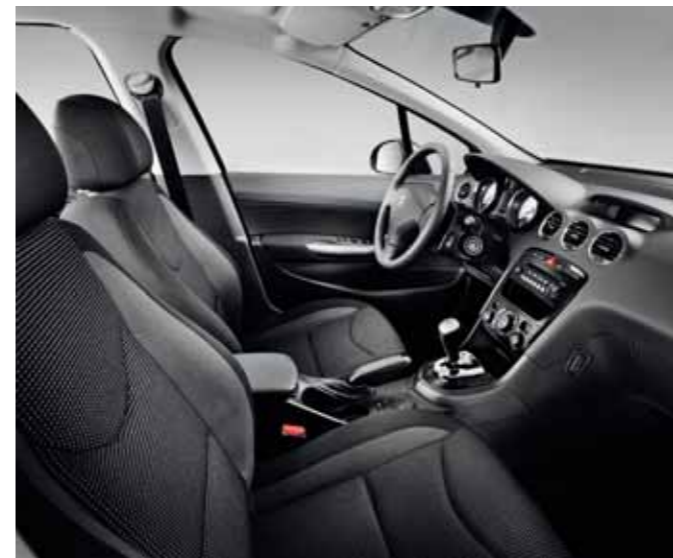
Allure – Strada