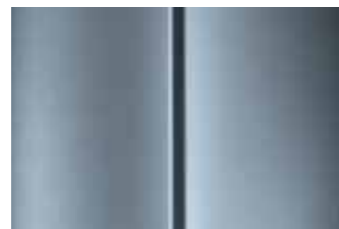
Серебристый (Gris Alu)